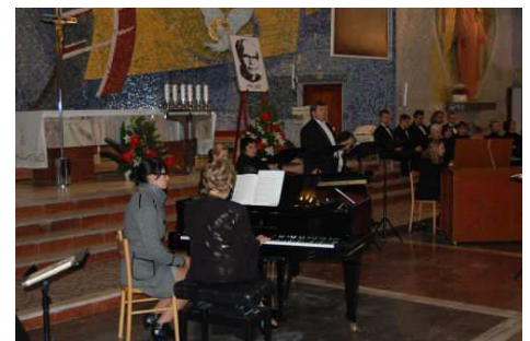
Koncert finałowy Festiwalu