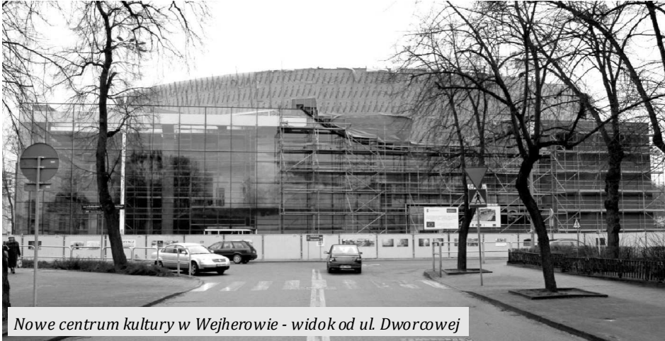
Nowe centrum kultury w Wejherowie - widok od ul. Dworcowej

W Redzie odbył się Zjazd Dyrektorów Instytucji Kultury Województwa Pomorskiego. Jednym z punktów spotkania był temat budowanej w Wejherowie Filharmonii Kaszubskiej.