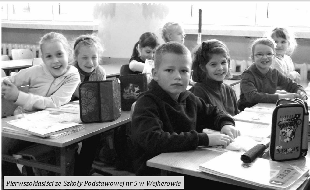
Pierwszoklasiści ze Szkoły Podstawowej nr 5 w Wejherowie

Władze Wejherowa zdobyły środki na realizację projektu "Czytam, liczę, rozwijam swoje zainteresowania - dobry start w edukację - indywidualizacja procesu nauczania i wychowania uczniów klas I-III szkół podstawowych w Gminie Miasta Wejherowa".