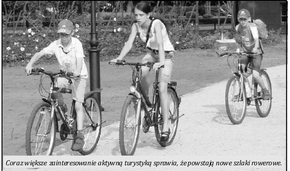
Coraz większe zainteresowanie aktywną turystyką sprawia, że powstają nowe szlaki rowerowe.