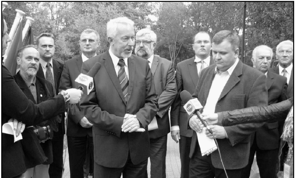
W wejherowskim parku odbyła się konferencja zwołana z okazji zakończenia projektu