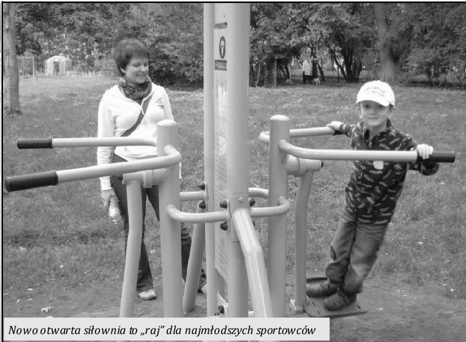
Nowo otwarta siłownia to „raj” dla najmłodszych sportowców