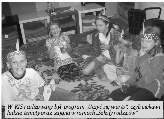
W KIS realizowany był program „Uczyć się warto”, czyli ciekawi ludzie, tematy oraz zajęcia w ramach „Szkoły rodziców”