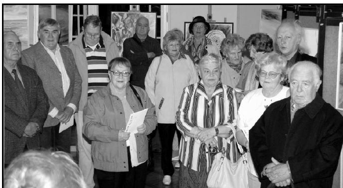
W XI Międzynarodowych Nadmorskich Spotkaniach Twórczych w Czymbarku udział 20 artystów w malarzy polskich i zagranicznych.