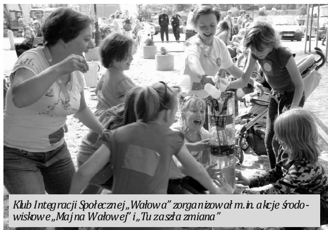
Klub Integracji Społecznej „Wałowa” zorganizował m.in. akcje środowiskowe „Majna Wałowej” i „Tu zaszała zmiana”